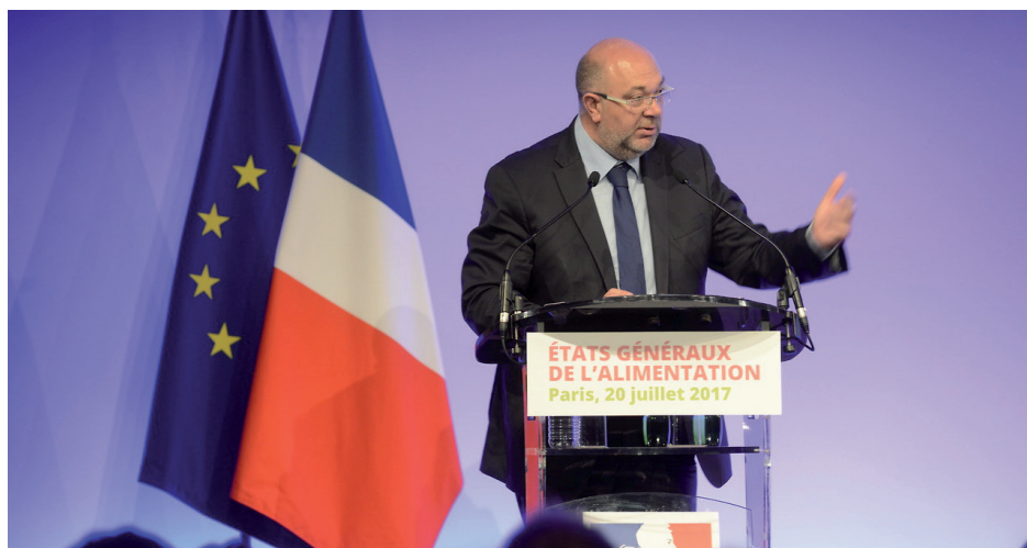
STÉPHANE TRAVERT A OFFICIELLEMENT LANCÉ LES ETATS GÉNÉRAUX DE L'ALIMENTATION. LES CONCLUSIONS DE LA PREMIÈRE PHASE DEVRAIENT ÊTRE ANNONCÉES PAR EMMANUEL MACRON.

Pour de nombreux interlocuteurs, l'interprofession apparaît comme le lieu de discussion adapté pour